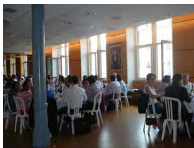
Près de 400 personnes au repas durant 3 jours