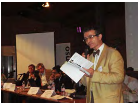
Henri Savall lors d'une session plénière

1 er Congrès transatlantique de Comptabilité, Audit, Contrôle de gestion, Gestion des coûts et Mondialisation organisé à Lyon conjointement par l'IIC (Institut International des Coûts) et l'ISEOR, en partenariat avec la American Accounting Association (Etats-Unis)