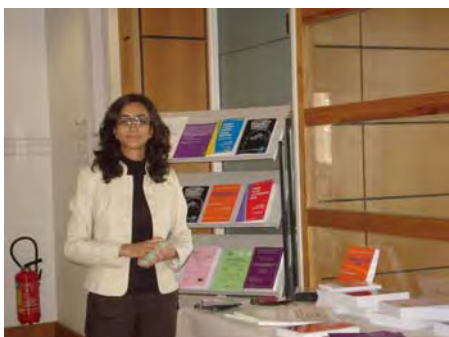
Quatre stands présentant les nombreuses publications de l'ISEOR